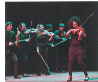
Els músics de Desconcerto

A banda de les activitats de celebració del 25è aniversari, l'Associació d'Espectadors també desenvolupa la seva programació habitual. La temporada s'inicia aquest divendres 19 d'octubre amb l'espectacle "Desconcerto", amb l'Orquestra de Cambra de l'Empordà. Es tracta d'un espectacle de música clàssica oberta a tots els públics que es combinarà amb l'humor, sota la direcció de Jordi Purí i Carles Coll. "Desconcerto" es podrà veure a partir de les 21h, amb entrades a 16 euros que es podran comprar a taquilla.