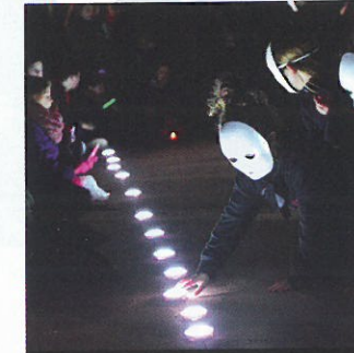
Pas de llum d'Epidemic