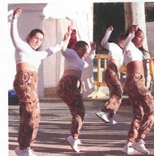
Inndit al carrer Sant Jaume