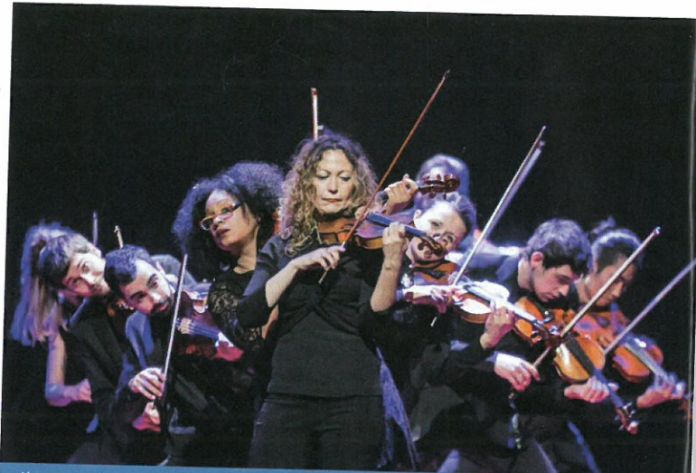
L'Orquestra de Cambra de l'Empordà inaugura una temporada amb grans noms sobre escena